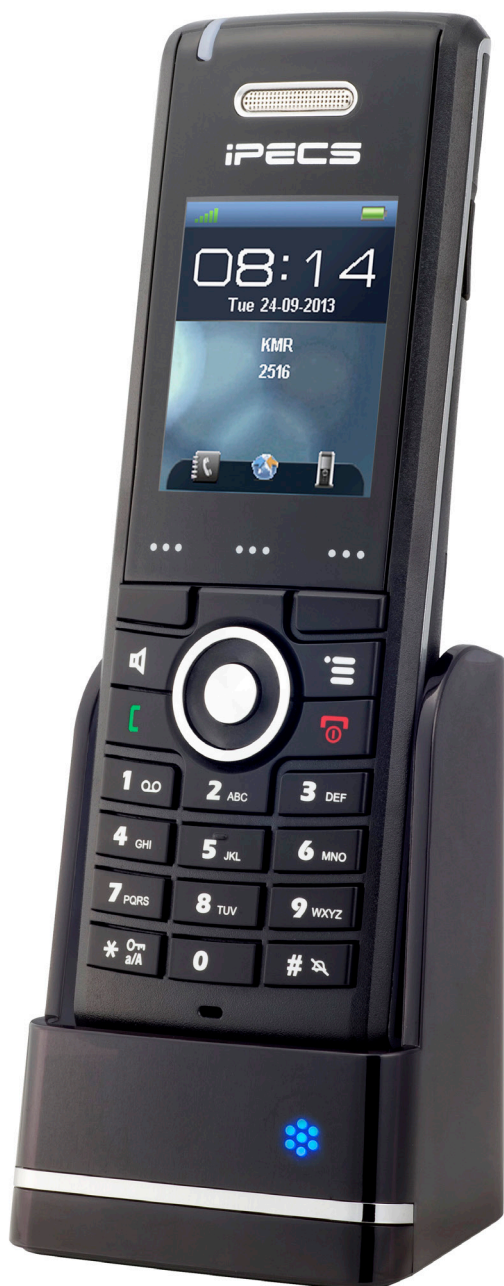
GDC-800H - Artikelnr: 20-81390-0

GDC-800H är en trådlös IP-DECT-telefon som passar till Ericsson-LGs telefonsystem och ger dig access till all den funktionalitet du behöver. Du kan t.ex. enkelt hantera hänvisningar, röstbrevlåda eller logga in/ut från de grupper du ingår i.